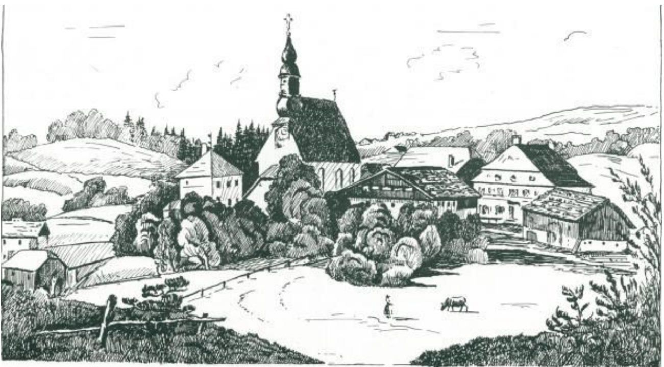
Oberhofen mit Hatzenhaus um 1840

Der Name des Pfarrortes Oberhofen (seit 1384 urkundlich belegt) soll von dem im Jahre 1903 abgebrannten Hatzenbauernhaus, das früher ein Meierhof des Klosters Mondsee war und der „obere Hof“ geheißen hat, seinen Ursprung haben. Das sicher noch ältere Dorf Rabenschwand soll von einem Mann namens Rhaben, der mit seinen Leuten diese Gegend einst gerodet hatte, herrühren. Das Wappen von Oberhofen, aus einem alten Schulzeugnis aus dem Jahre 1845 ersichtlich, zeigt einen auf einer Wolke knieenden Abt mit Stab und 2 Schriftrollen. Die zu Ende des 14. Jahrhunderts im gotischen Stil erbaute Kirche besitzt ein sehr altes Bild, ein Ölgemälde, das die 14 hl. Nothelfer darstellt, deren Namen mit alten gotischen Buchstaben bemalt sind. Die älteste Glocke trug die Jahreszahl 1494.