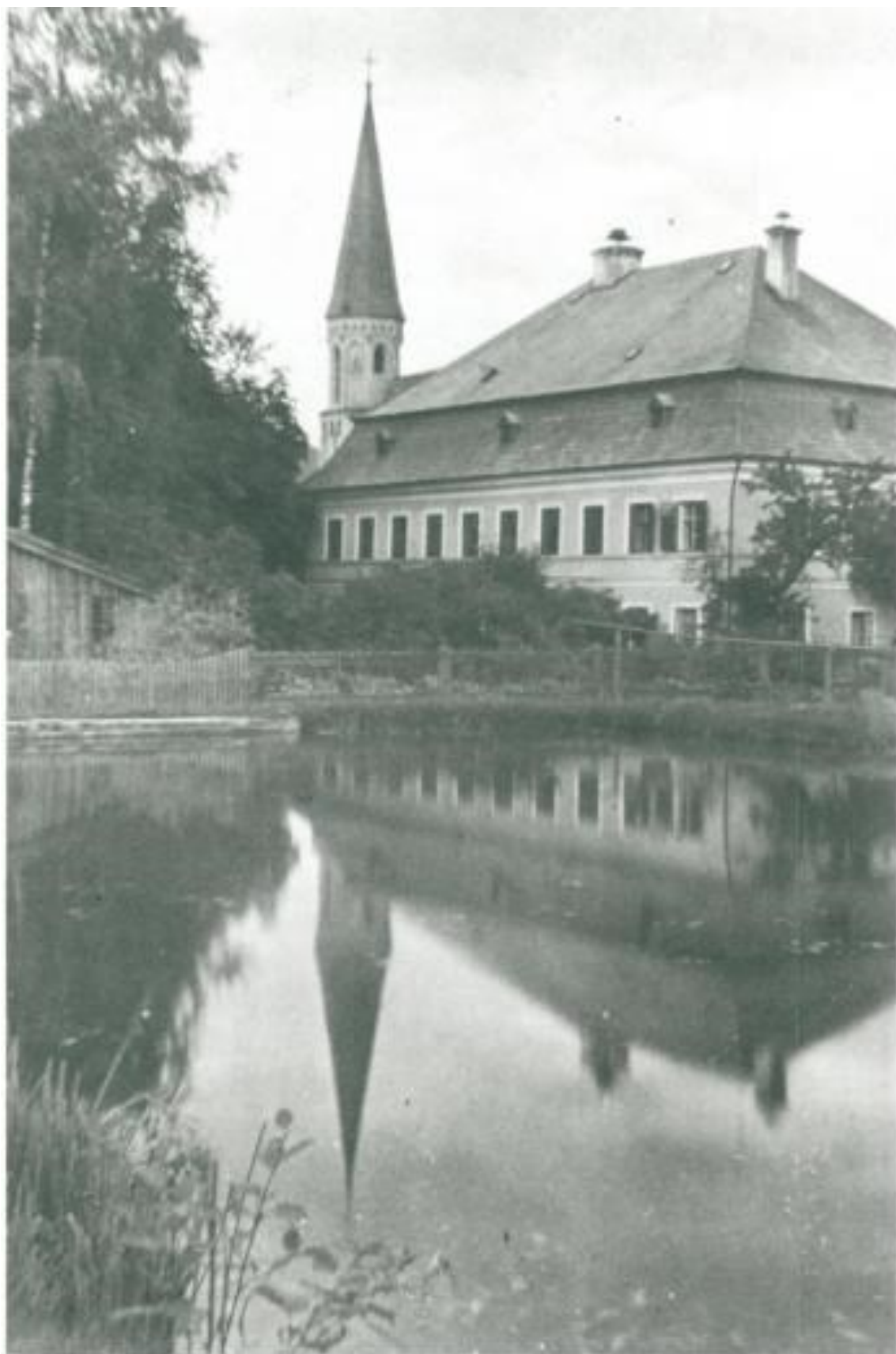
Gasthaus Schönauer mit Eisteich und Bienenhaus 1930