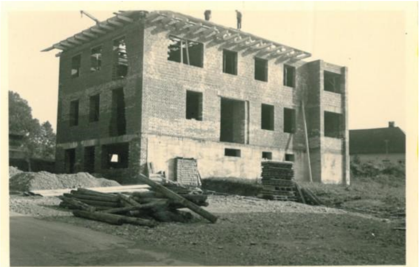
Foto: Das Amtshaus im Rohbau