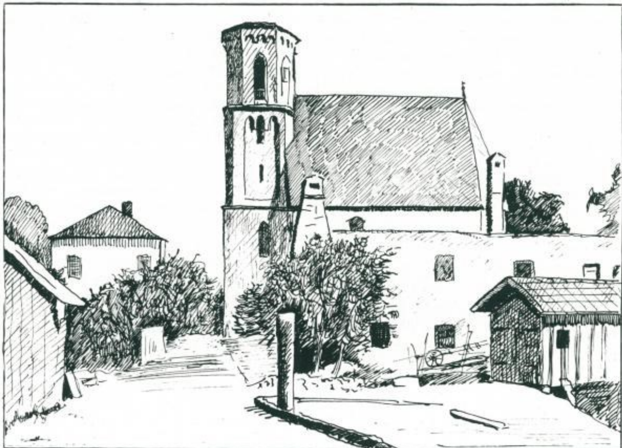
Oberhofen nach dem Brande im Jahre 1903